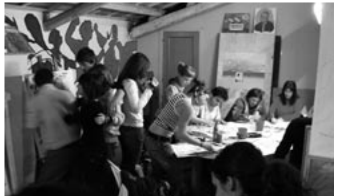
Una giornata all'Atelier con l'Istituto d'Arte "Mannucci" di Jesi e l' "Atelier du non faire" di Parigi

Lo stimolo arriva dall'edizione del 2004 della Rassegna Malati di Niente in cui, nello spirito del "provare a confrontarsi, a inquinarsi, ad imparare mutuamente", incontriamo l'esperienza dell'Atelier