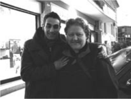
Gita a Gubbio