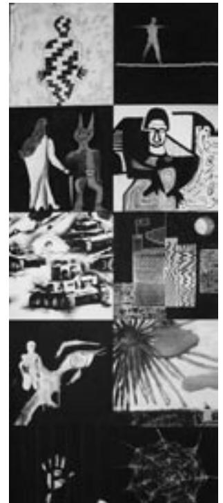
Opera collettiva dell'Atelier e dell'Istituto d'Arte

Nel 2008 la bottega del Commercio Equo e Solidale di Chiaravalle ci chiede di inserirci nel ciclo di esposizioni di artisti locali. Nel novembre dello stesso anno l'Atelier di Pittura partecipa ad "IntegrArti", una mostra organizzata dal Comune di Fano che mette in esposizione opere realizzate da tutte le esperienze di Atelier di pittura in ambito riabilitativo attive nella regione, con lo scopo anche di mettere in comunicazione realtà differenti che condividono percorsi affini. ■