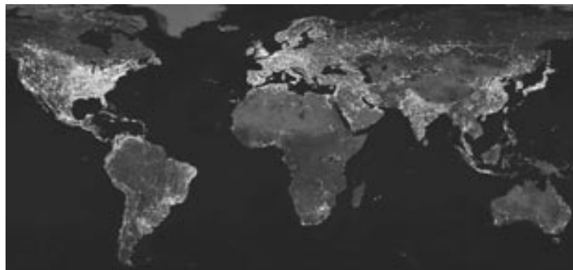
Inquinamento luminoso nel mondo

ignorati, sebbene in città avvengano modifiche e sostituzioni di impianti di pubblica illuminazione senza che si possa verificarne la conformità. La situazione a Jesi è altamente critica non solo per il 90% dell'intero parco illuminante, che è fuori norma e che andrebbe sostituito con la prospettiva di un conseguente contenimento dello spreco energetico, valutabile intorno al 35%, ma perché tutta Jesi è secondo la 10/02 "zona protetta", in quanto