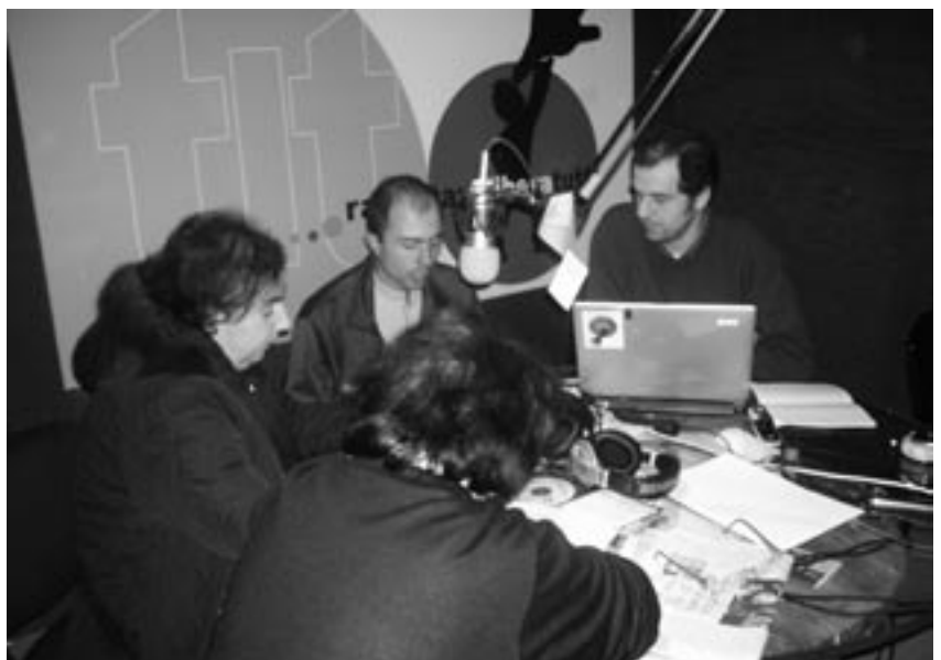
Durante una trasmissione

Questa trasmissione, nella quale sono transitati