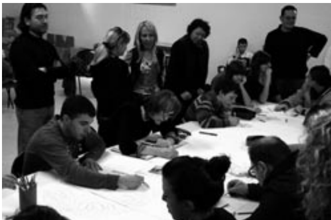
Gli alunni dell'Istituto d'Arte "Mannucci" ospitano gli artisti dell'Atelier nella loro giornata autogestita