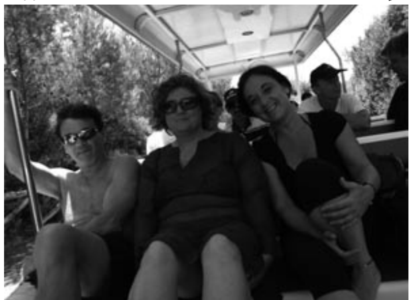
Sul trenino del Villaggio Valentino di Castellaneta

oggetti più disparati. Per noi, ormai abituati alla banale omogenizzazione dei supermercati della grande distribuzione, quegli antri bui e dimessi emanavano un fascino strano ed inconsueto. La loro magia probabilmente li preserva da balzelli