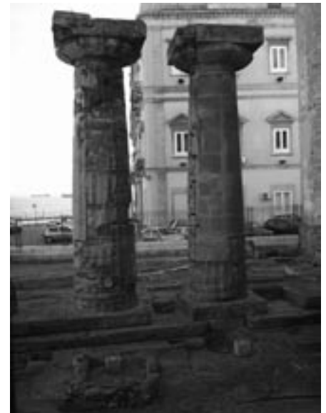
Taranto: colonne doriche