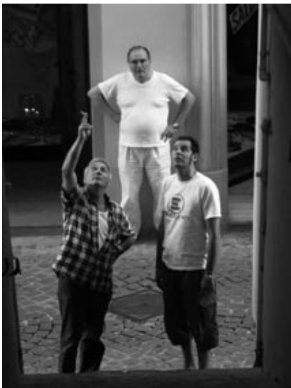
Gita a Esanatoglia

Ma è ancora il tempo che incalza, è quasi l'imbrunire. Bisogna far ritorno prima o poi... ■