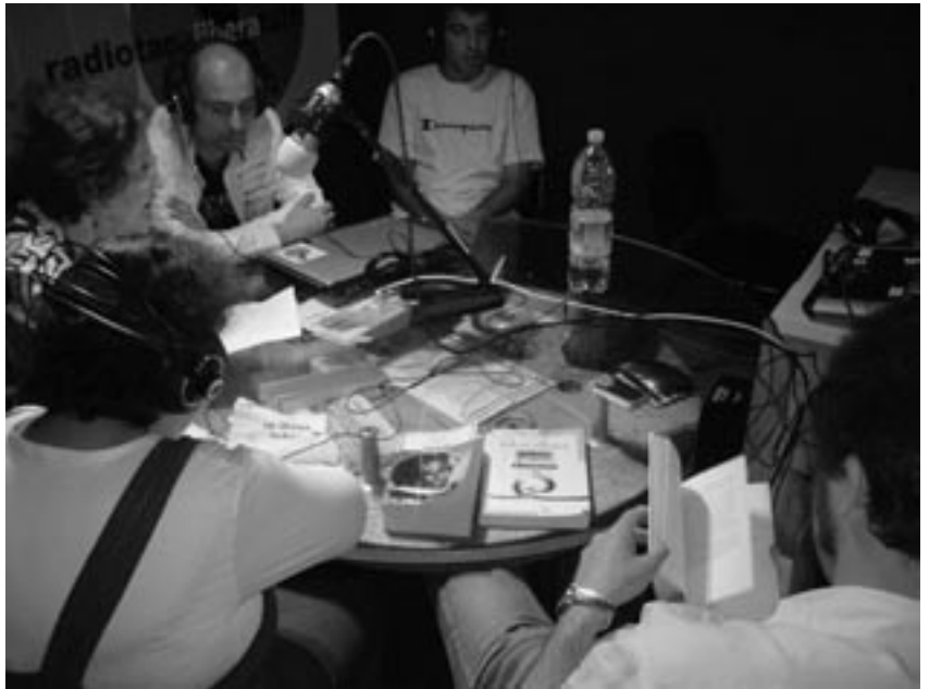
Durante una trasmissione

manicomi. L'anno scorso, infatti, proprio durante una riunione di redazione della rivista, ad una nostra amica venne la brillante idea di intervistare gli psichiatri del Dipartimento di Salute Mentale di Jesi, per chiedere loro una valutazione di questi trent'anni della legge. Abbiamo quindi preparato una batteria di domande, che abbiamo sottoposto a quasi tutti gli psichiatri del DSM. Per ogni intervista, cui hanno partecipato molti amici, abbiamo