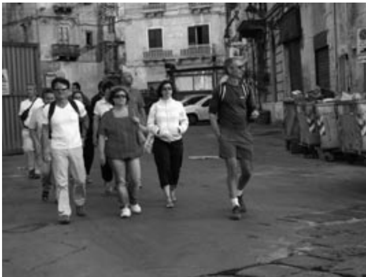
Per le vie di Taranto fondo alla gravina, appunto!)

E infine Taranto con i suoi palazzi rossi, il mare azzurro, la fortezza aragonese, il ponte girevole e la città antica con le due arcaiche colonne doriche a vegliare inutilmente la triste decadenza delle case e dei palazzi in rovina; lontano le grandi gru del porto al tramonto... In redazione le rievocazioni dei viaggiatori e vacanzieri rientrati alla base continuano. "Da dove venite?" ci avevano chiesto due ragazze sedute su una panchina del parco tarantino di Villa Peripato. In redazione ancora la domanda riemerge e si trasforma, sospesi tra passato e futuro, tra sottili tristezze e desideri di nuove avventure, in un: "Dove andremo?". ■