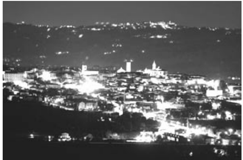
Jesi di notte

Di contro, purtroppo vi sono da segnalare le forti negligenze da parte