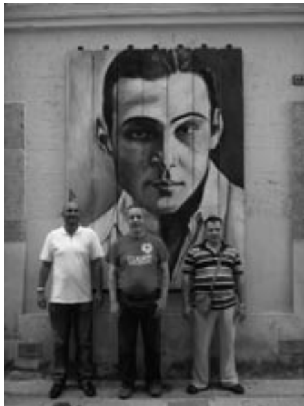
Gli autentici Rodolfo Valentino

La prima cosa che l'ha colpita è stata l'atmosfera che si percepiva nelle chiese, dove al riparo del sole e della luce intensa si potevano ammirare dipinti ed affreschi che adornavano le volte delle navate, sostenute da fughe di colonne di marmo rosa, purtroppo finto! Questo è stato per lo meno il verdetto emesso da