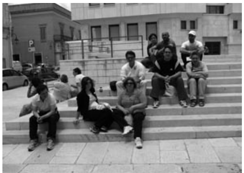
Break a Taranto