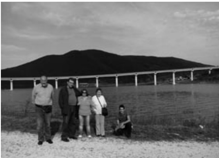
Gita al Lago di Castreccioni di Cingoli

Questa l'essenza del viaggio secondo A: "Quando sono all'interno del pulmino mi sento bene. Osservo il paesaggio, mi lascio attraversare da esso. Mi sento meno solo". Come dargli torto? - penso - In fondo vedere deipaesaggidalfinestrinosignificaconoscerli due volte: con lo sguardo e col desiderio. Ma non è tempo di tante elucubrazioni, il viaggio incombe, occorre seguire la strada.