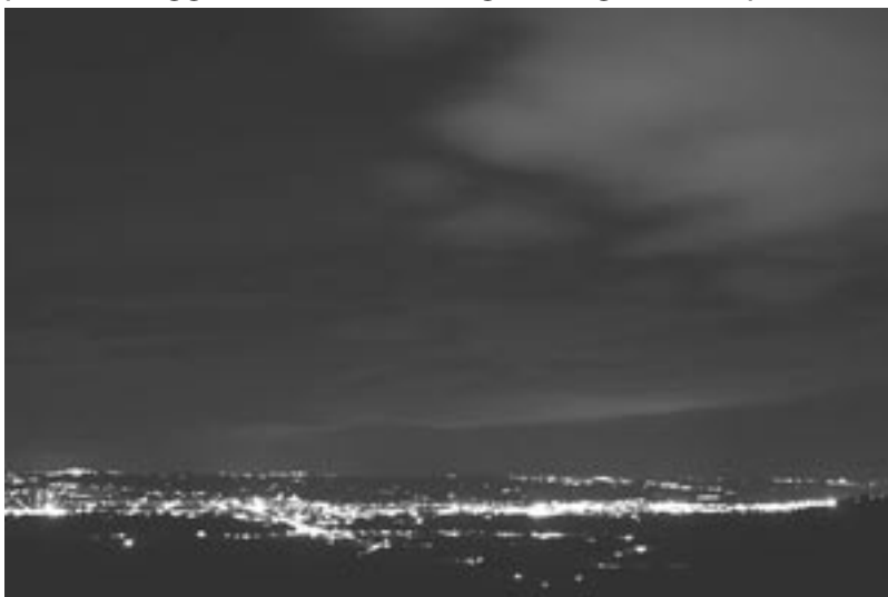
Panorama notturno di Jesi: le nuvole riflettono l'inquinamento luminoso aumentando il bagliore

Coloro che vorranno saperne di più avranno la possibilità di approfondire la tematica, avere informazioni generali sul fenomeno, avere informazioni tecnico-giuridiche sulla legge 10/02, sulle delibere del Comune in materia e soprattutto