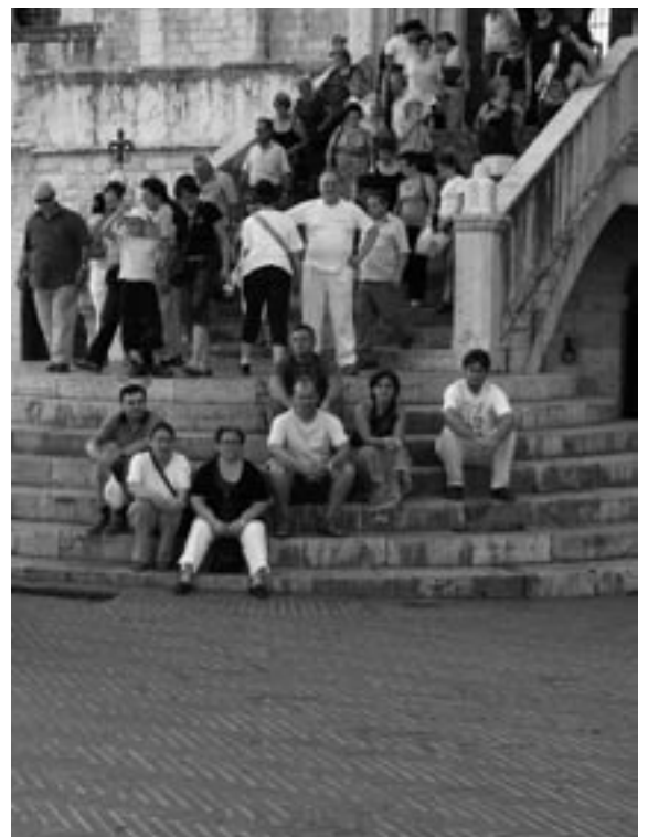
Gita a Gubbio